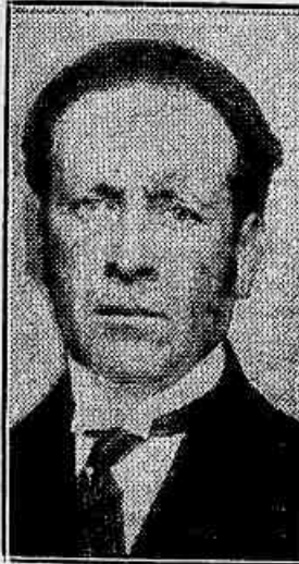
General Flores da Cunha

General Flores da Cunha Porto Alegre, 12 (Havas) — O "Correio do Povo" recebeu de Uruguiana a informação, que por um esforço de reportagem conseguiu saber, de que "o sr. Flores da Cunha, satisfeito com o accordo politico, vendendo a familia riograndense em paz e cheia de satisfação por estar novamente intima, dissera numa roda íntima que tinha chegado para elle a hora do repouso e do descanso, pois está cumprida a sua missão e realizado o seu maior sonho. Pedirá licença e não assumirá mais as reideas do governo. Por isso comprou o campo de Birochay, tendo já mandado atacar as obras de construcção da sua vivienda. O sr. Flores da Cunha ficará residindo no municipio de Uruguiana". Estas informações foram prestadas por pessoa íntima do general. Jacques Banville não terá exequias religiosas Paris, 12 (Havas) — O Arcebispo de Paris recusou permissão para a realização das exequias religiosas de Jacques Banville. As autoridades tomaram esta decisão em vista das ligacões do escritor extinto com as doutrinas da Action Française, de onde foi um dos fundadores.